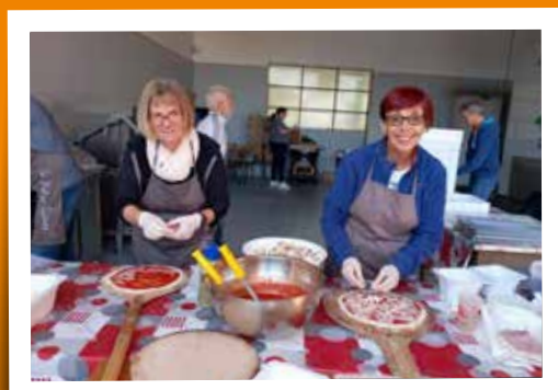
La Mie du Four - juin