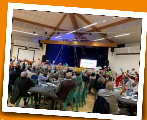
Après-midi détente CCAS - 2 juin