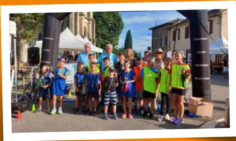
La Magie du Confluent, Course des enfants (Randonneurs) - 13 juillet