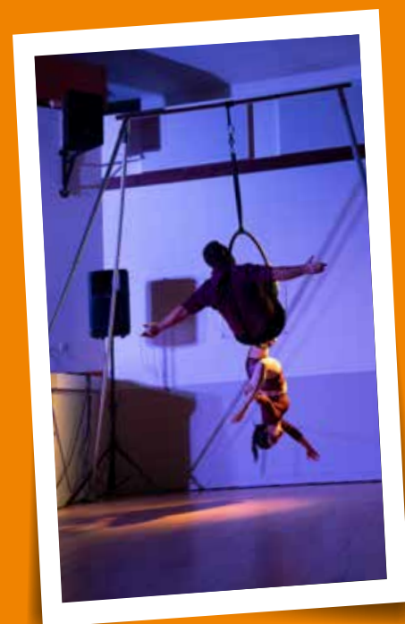
Gala Aéri'Ain - 6 juillet