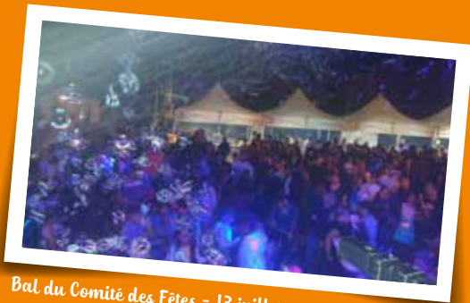
Bal du Comité des Fêtes - 13 juillet