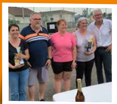
Finale tournoi tennis - 29 juin