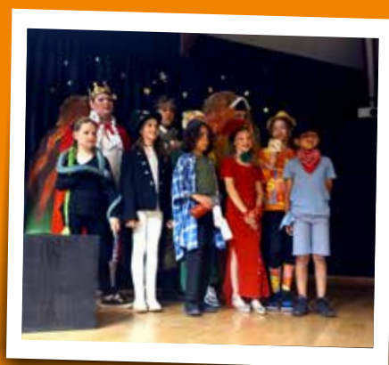
Derrière Le Rideau enfants ados - 15 juin