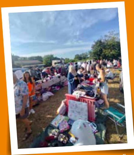
Vide-greniers Les Amis des Gaboureaux - 4 août