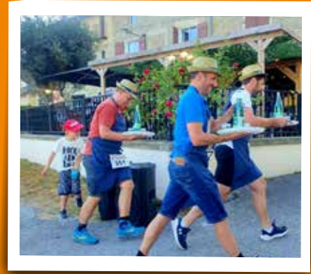
Course des garçons de café (Randonneurs) - 13 juillet