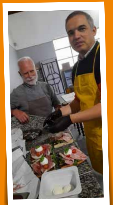
La Mie du Four - 14 septembre