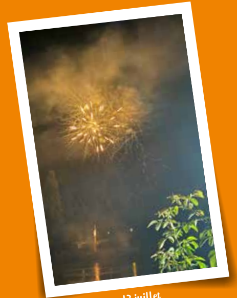
Feu d'artifice - 13 juillet