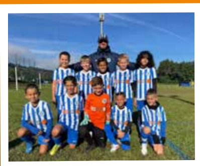
Rentrée des petits de L'USPA - 15 septembre