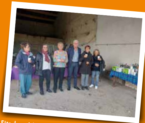
Fête des voisins Les Amis des Gaboureaux - 13 septembre