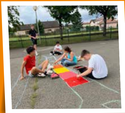
Chantier dispositif argent de poche - juillet