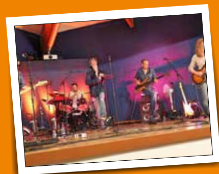
Fête de la musique - 21 juin