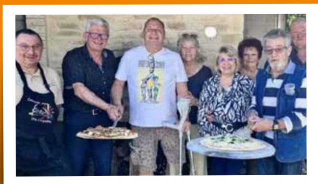
Venue des Belges (jumelage) - 10 mai