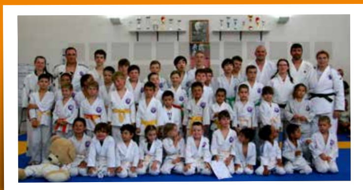
Gala judo - 29 juin