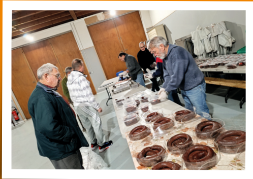
Boudin du Patrimoine - 24 février