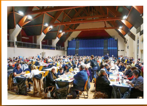
Loto USPA - 26 janvier