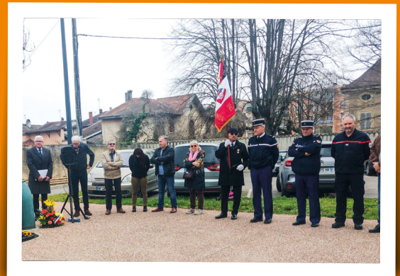
Commémoration du cessez-le-feu en Algérie - 19 mars