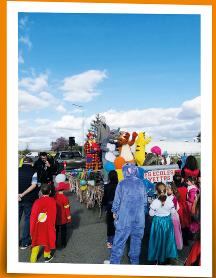
Carnaval du Sou des Ecoles - 16 mars