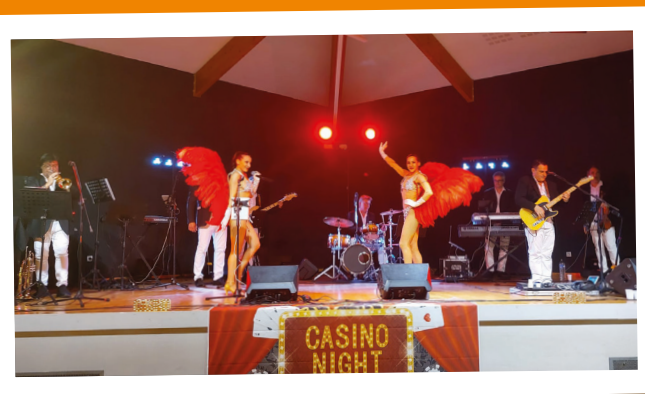
Bal de la Municipalité - 20 avril