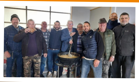
Matinée cochonnaille de la Chasse - 20 avril