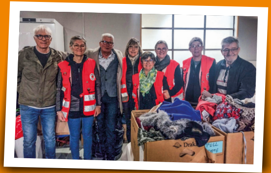
Braderie de la Croix Rouge - 30 mars