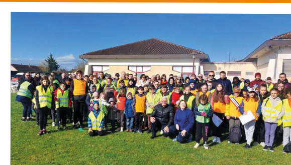
Nettoyage de Printemps - 23 mars