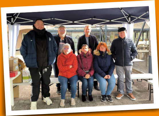
Saucissons briochés du tennis - 24 mars