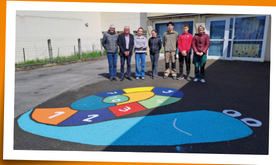
Chantier Dispositif Argent de Poche - avril