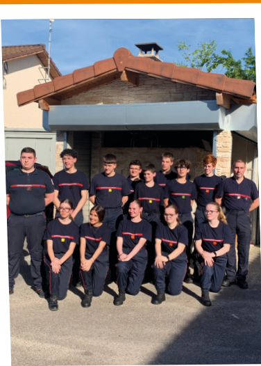
Pizzas et tartes Jeunes Sapeurs Pompiers & La Mie du Four - 13 avril