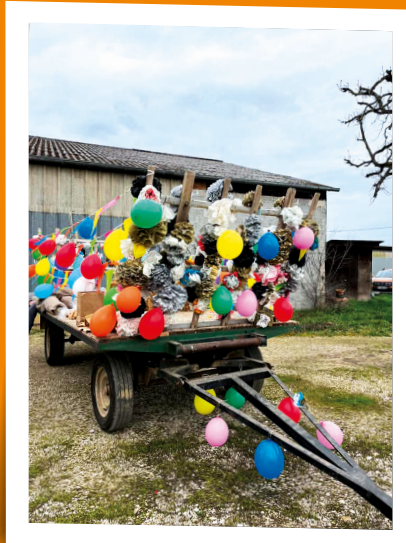
Carnaval des Amis des Gaboureaux - 9 mars