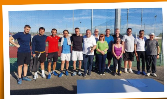
Remise des prix du tennis - 14 avril