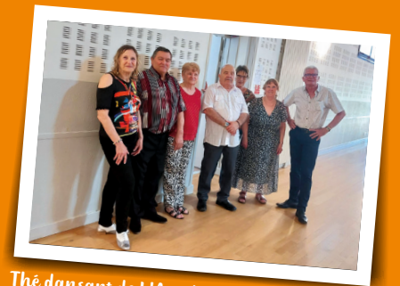
Thé dansant de l'Age d'Or - 14 avril