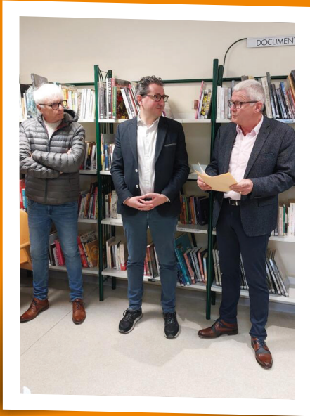
Exposition concours photos SR3A - février 2024