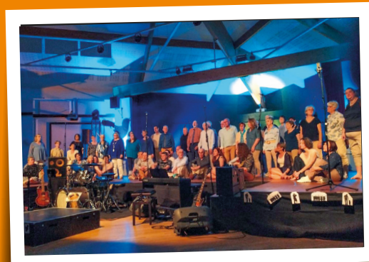
Concerts L'Accroche Choeur - 6 et 7 avril