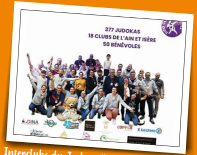
Interclubs du Judo - 4 février