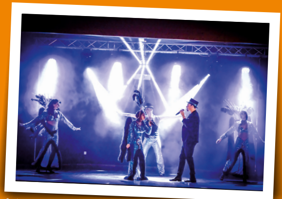
Cabaret du Comité des Fêtes - 23 mars