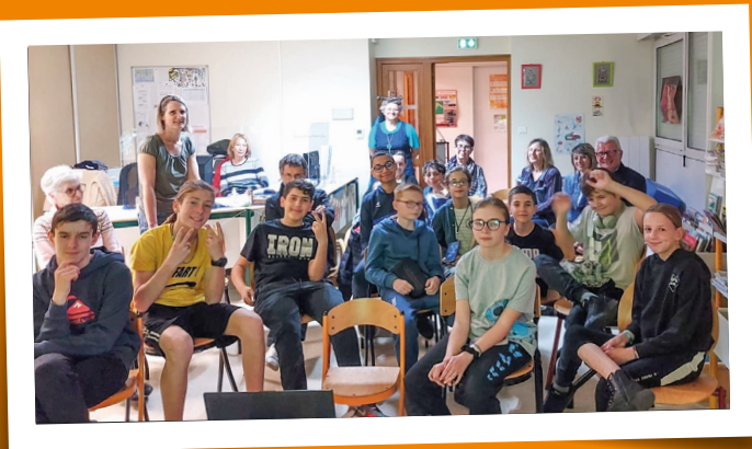
Fête du Court Métrage de la Maison Des Jeunes - 22 mars