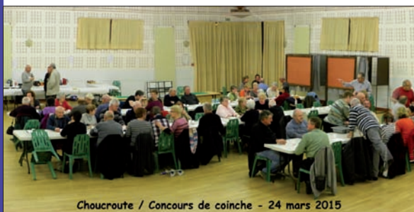
Choucroute / Concours de coinche - 24 mars 2015

Et comme on dit au Club : "Joie et bonne humeur sont les mamelles de l'Age d'Or"