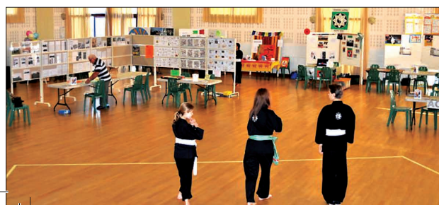
Bulletin Loyettes 13.indd 1

Ce forum a été une vraie réussite. Les Loyettains sont venus nombreux nous visiter dans la journée et assister au spectacle du soir. Nous avons eu plusieurs demandes pour organiser ce forum chaque année. Nous en reparlerons avec les associations.